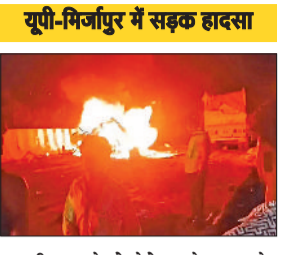
यूपी-मिर्जापुर में सड़क हादसा

मिर्जापुर(उप्र)। मिर्जापुर में बुधवार रात भीषण सड़क हादसा हो गया। बोलेरो-ट्रक की टक्कर में 8 लोग जिंदा जल गए। एक अन्य कार सवार समेत ट्रक के ड्राइवर और खलासी की दबकर मौत हो गई। जलकर मरने वाले सभी बोलेरो में सवार थे।