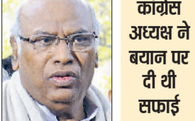
कांग्रेस अध्यक्ष ने बयान पर दी थी सफाई

चुनाव आयोग (ईसी) ने बुधवार को कांग्रेस अध्यक्ष मल्लिकार्जुन खरगो को नोटिस जारी कर जवाब मांगा है। आयोग के अधिकारियों ने बताया कि खरगो से 24 घंटे के भीतर अपना रुख स्पष्ट करने को कहा गया है। भाजपा ने पीएम मोदी को आतंकी कहने के मामले में चुनाव आयोग से खरगो की शिकायत की थी। दरअसल खरगो ने मंगलवार को चेन्नई में चुनाव प्रचार के दौरान पीएम मोदी को आतंकी कहा था। हालांकि बाद में उन्होंने बयान पर सफाई देते हुए कहा था कि पीएम मोदी लोगों और राजनीतिक पार्टियों को डरा रहे हैं। मैंने कभी नहीं कहा