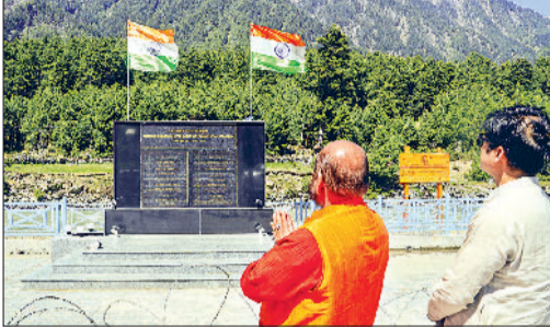
हमले में मारे गए मासूमों के स्मारक पर श्रद्धांजलि देते लोग

पहलगाम आतंकी हमले को 22 अप्रैल को एक साल पूरा हो गया है और इस मौके पर पीएम नरेंद्र मोदी ने उस दर्दनाक घटना में जान गंवाने वाले निर्दोष लोगों को याद किया। उन्होंने कहा कि उनकी संवेदनाएं उन सभी परिवारों के साथ हैं, जो आज भी इस अपार दुख को झेल रहे हैं। उन्होंने कहा कि भारत आतंकवाद के आगे कभी नहीं झुकेगा और न ही कभी आतंकवादियों के नापाक मंसूबे कामयाब होंगे।