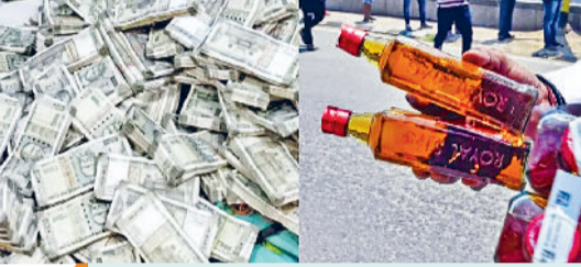
22 अप्रैल तक के आंकड़े जारी किए

एजेंसी नई दिल्ली। देश के अलग-अलग राज्यों और केंद्रशासित प्रदेशों में हो रहे विधानसभा चुनाव और उपचुनाव से पहले चुनाव आयोग की सख्ती का बड़ा असर देखने को मिला है। आयोग के मुताबिक, तमिलनाडु और पश्चिम बंगाल में अब तक 1000 करोड़ रुपये से ज्यादा का कैश, शराब, ड्रग्स और अन्य सामान जब्त किया जा चुका है। चुनाव आयोग ने कहा कि इसके साथ ही सभी राज्यों और केंद्र शासित प्रदेशों को आदर्श आचार संहिता का सख्ती से पालन करने के निर्देश दिए गए थे।