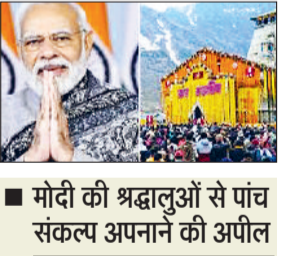
मोदी की श्रद्धालुओं से पांच संकल्प अपनाने की अपील

भाषा देहरादून। प्रधानमंत्री नरेन्द्र मोदी ने बुधवार को श्रद्धालुओं से चारधाम यात्रा के दौरान 'डिजिटल उपवास' रखकर उत्तराखंड के प्राकृतिक सौंदर्य का आनंद लेने का आह्वान करते हुए उनसे पांच संकल्पों का भी पालन करने का आग्रह किया है। रुद्रप्रयाग जिले में स्थित भगवान शिव के धाम केदारनाथ के कपाट खुलने के मौके पर सोशल मीडिया पर अपने एक शुभकामना संदेश में प्रधानमंत्री ने कहा कि केदारनाथ सहित चारधाम की यह यात्रा हमारी आस्था, एकता और समृद्ध परंपराओं