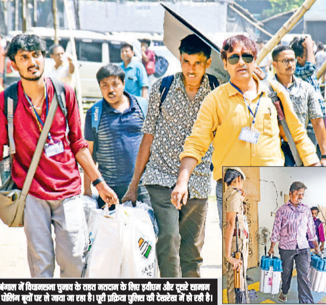
तमिलनाडु और बंगाल में विधानसभा चुनाव के तहत मतदाता के लिए प्रतीक और सूटकेट सामान को अलग-अलग पैकिंग में तैयार कर दिया गया है। प्रतीक पैकिंग पुलिस की देखरेख में हो रही है।

कार्रवाई करने का निर्देश दिया गया। पत्र में प्राथमिकी दर्ज करने, संबंधित प्रावधानों के तहत नोटिस जारी करने, जहां आवश्यक हो वहां निवारक हिरासत की कार्रवाई करने, संबंधित व्यक्तियों को गृहत बंदाने और चुनाव अवधि के दौरान नामित व्यक्तियों की गतिविधियों पर कड़ी निगरानी रखने जैसे कदम सुझाए गए हैं। इसमें कहा गया है, 'इनमें से किसी भी व्यक्ति द्वारा मतदाताओं को डराने-धमकाने या अशांति फैलाने के किसी भी मामले को गंभीरता से लिया जाएगा।