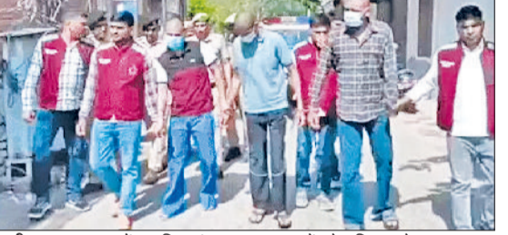
फरीदाबाद। बदमाशों का सिर मुंडाकर बाजार में परेड निकालते हुए।