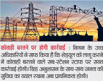
कोताही बरतने पर होगी कार्रवाई : निगम के उच्च अधिकारियों ने साफ किया है कि शेड्यूल को लागू करने में कोताही बरतने वाले सब-स्टेशन स्टाफ पर सख्त कार्रवाई होगी। विड अनुशासन के साथ-साथ जनता की सुविधा का ख्याल रखना अब प्राथमिकता होगी।

■ नए शेड्यूल के अनुसार, हिसार जौन सहित अन्य क्षेत्रों में शाम होते ही बिजली की सप्लाई शुरू कर दी जाएगी, जो बिना रुके अगली सुबह तक जारी रहेगी। हिसार जौन में शाम 07:00 बजे से सुबह 06:30 बजे तक (लगतार साढ़े 11 घंटे रात की सप्लाई) होगी।