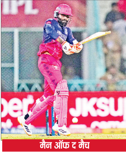
मैन ऑफ द मैच