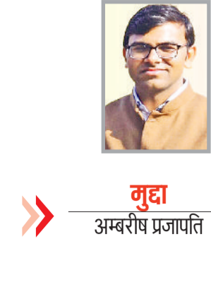
(लेखक वरिष्ठ रसमखर हैं, ये उनके अपने विचार हैं।)